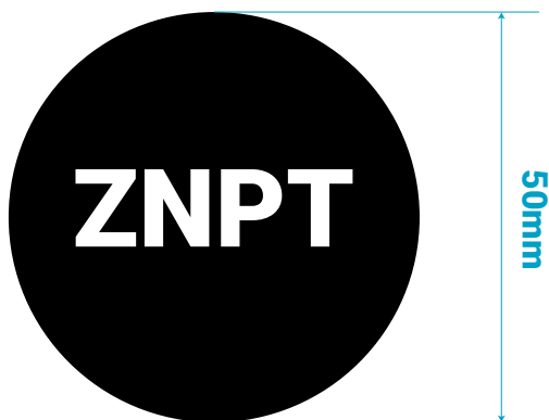
JEDNODUCHÁ SAMOLEPKA S TEXTEM UVNITŘ