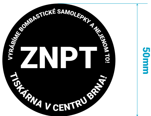
SLOŽITÝ DESIGN SAMOLEPKY S TEXTY PO OBVODU